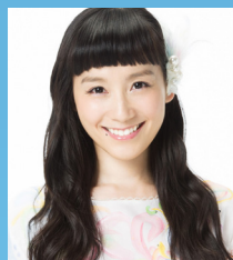
篠原 ともえ氏 [司会・進行] タレント・アーティスト