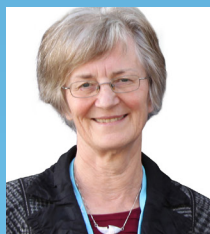
スーザン パール氏 国際北極科学委員会(IASC) 議長 / 極域歴史家