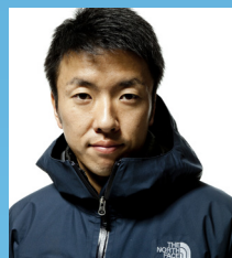
石川 直樹氏 写真家

北極の気候変動は富山の自然をどう変えるのか。 私たちになにができるのか。一緒に考えてみませんか？